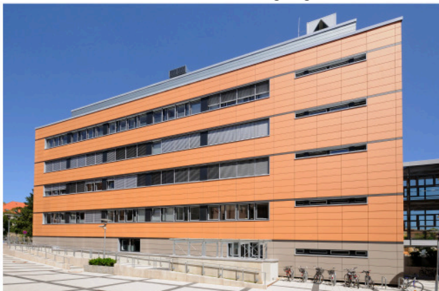
Bilder unten: Ärztehaus mit Zufahrt Tiefgarage